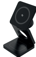
Foldable 3in1 Wireless Charger MagCharge WM4B