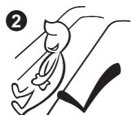
2 Cross your hands over chest before sliding down