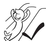
or Slide with arms UP on this slide