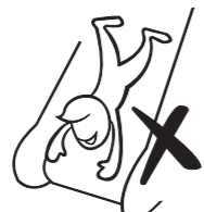
Never slide down head first