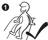
1 Sit on the platform Do not stand up