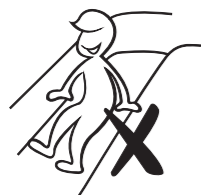
Do not touch the two sides of the slide