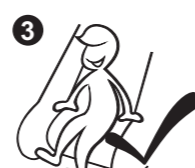
3 Sliding finish