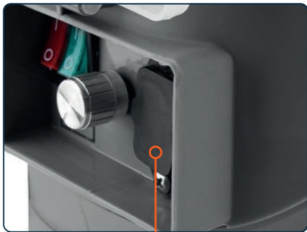
Miejsce podłączenia ładowarki

Poziom naładowania akumulatora można sprawdzić na wyświetlaczu.