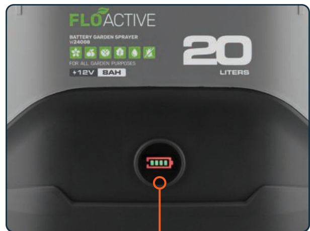
Poziom naładowania baterii