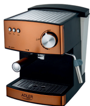
Espresso Machine AD 4404