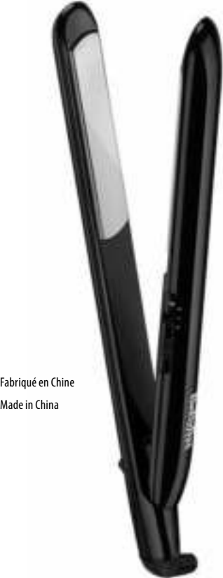
Fabriqué en Chine