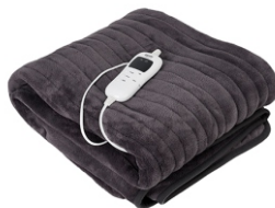
Super soft heating blanket CR 7418