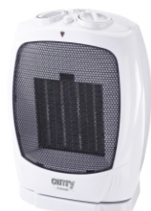
Ceramic Heater CR 7718