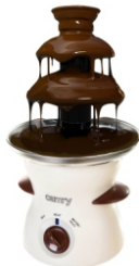
Chocolate Fountain CR 4457