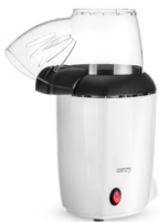
Popcorn maker CR 4458