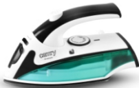
Travel Iron CR 5024