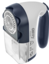
Lint remover CR 9606