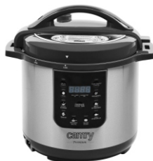
Pressure cooker CR 6409