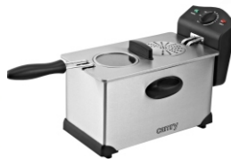
Deep Fryer 3L CR 4909