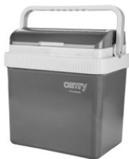
Portable cooler CR 8065