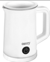
Milk Frother CR 4464