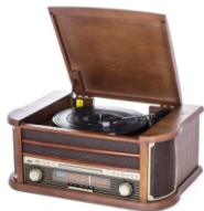
Turntable with radio CR 1111