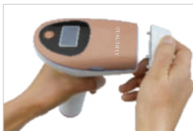
Pull out lamp