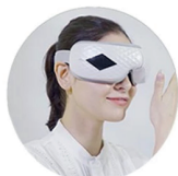
Zmiana intensywności masażu uciskowego