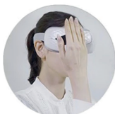
Przełączanie trybów masażu uciskowego