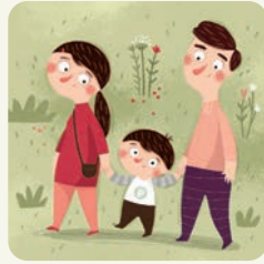
Idę na spacer z rodzicami.