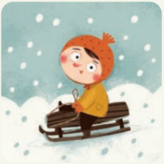
Bawię się na dworze.