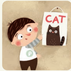
Uczę się mówić w języku obcym.