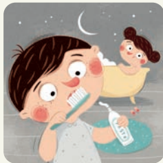
Myję zęby i kąpię się.