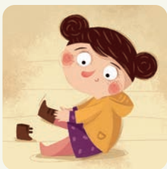
Ubiaram się przed wyjściem.