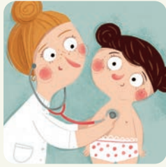
Idę do lekarza.