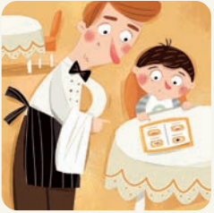
Idę do restauracji.