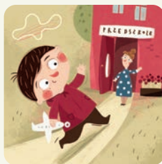
Idę do przedszkola.