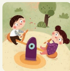
Idę na plac zabaw.