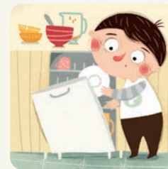
Pomagam sprzątać po posiłku.