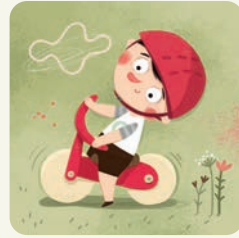
Bawię się na dworze.