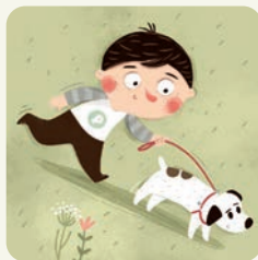
Wyprowadzam psa na spacer.