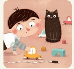
Bawię się w domu.