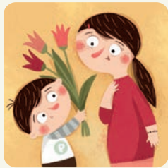
Świętuję Dzień Matki.