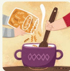
Pomagam w gotowaniu. / Rodzice gotują, ja się bawię.