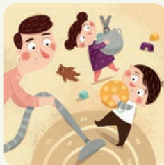
Sprzątam w domu.