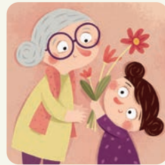
Świętuję Dzień Babci.