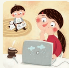
Mama pracuje, ja się bawię.