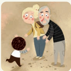
Spotykam się z dziadkami.