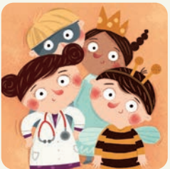
Idę na bal przebierańców.