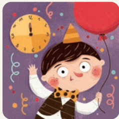
Idę na zabawę sylwestrową.