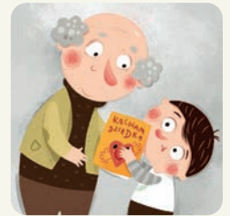
Świętuję Dzień Dziadka.