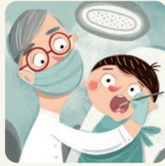
Idę do dentysty.