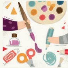
Maluję, rysuję, wycinam.