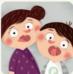
Wykonuję ćwiczenia logopedyczne.