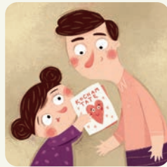
Świętuję Dzień Ojca.