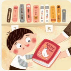
Idę do biblioteki.