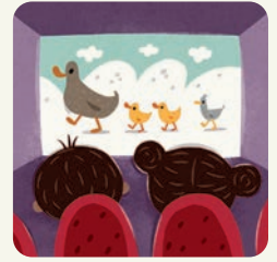
Idę do kina.