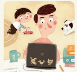
Tata pracuje, ja się bawię.