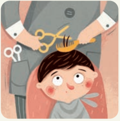
Idę do fryzjera.