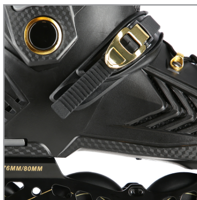
A. Część klamry napinającej, którą należy wcisnąć