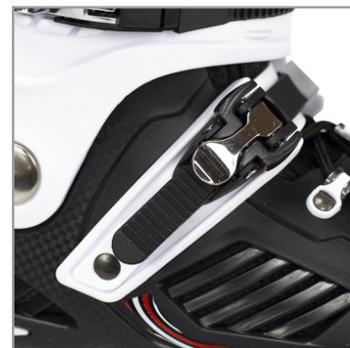
B. Część klamry napinającej, którą należy wcisnąć i popchnąć w dół