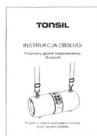
Instrukcja obsługi *1