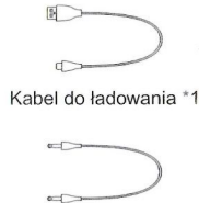
Kabel do ładowania *1