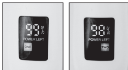
(obr.2 pro PN3020) (fig.2 for PN3020)