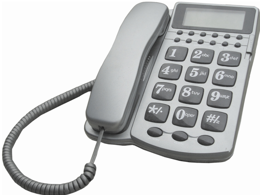
Aparat telefoniczny przewodowy MT-512 BB Maria