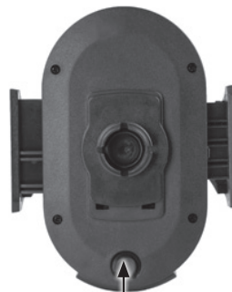
Przycisk do automatycznego wysuwania ramion bocznych

Umieść urządzenie w uchwycie a następnie delikatnie ściśnij boczne ramiona, aż do wycucia oporu. Sprawdź poprawne mocowanie telefonu w uchwycie, tak aby boczne trzymanie było stabilne i nie doprowadziło do wysunięcia się telefonu z uchwytu i jego uszkodzenia.