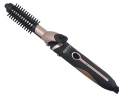
Hair styler set CR 2024