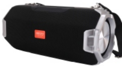
Bluetooth Speaker CR 1170