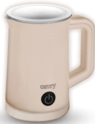
Automatic milk frother CR 4464