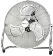
Velocity Fan CR 7306