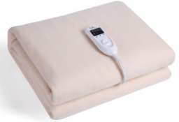
Electric Blanket CR 7407