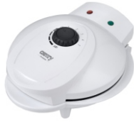
Waffle maker CR 3022