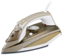
Steam iron CR 5018