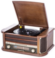
Turntable with radio CR 1111