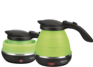
Foldable Electric Kettle CR 1265