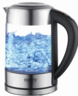
Kettle with temp. control CR 1289