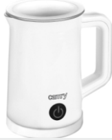
Milk Frother CR 4464