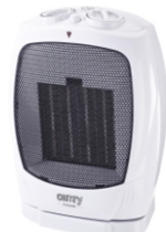
Ceramic Heater CR 7718