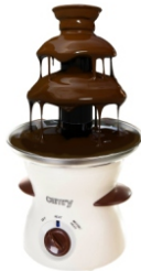
Chocolate Fountain CR 4457