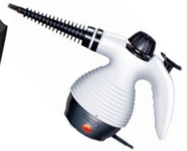
Steam Cleaner CR 7021