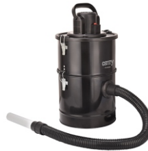
Ash Vacuum 25L 1200W CR 7030