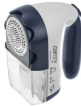
Lint remover CR 9606