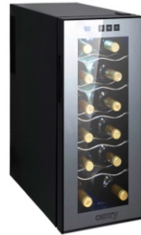
WINE COOLER CR 8068