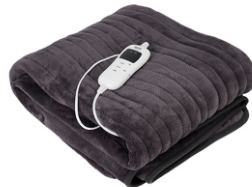
Super soft heating blanket CR 7418