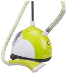
Steam Cleaner CR 5020