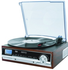
Turntable CR 1113