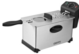
Deep Fryer 3L CR 4909