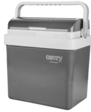
Portable cooler CR 8065