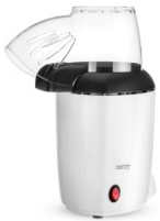
Popcorn maker CR 4458