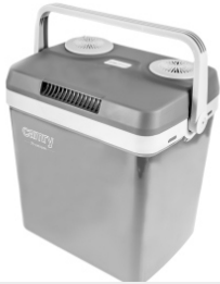
Portable Cooler CR 93