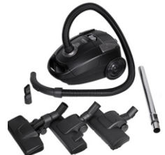
Super silent vacuum cleaner CR 7037