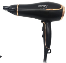
Hair Dryer CR 2255