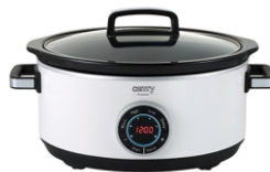
Slow Cooker CR 6410