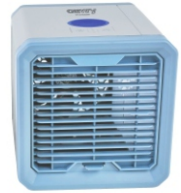
Easy Air Cooler CR 7318