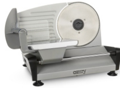
Food Slicer CR 4702