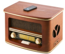
Retro radio CR 1109