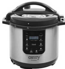
Pressure cooker CR 6409