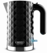
Electric Kettle CR 1169