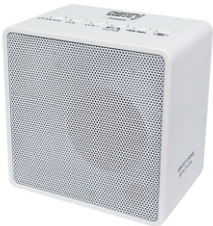
Cube Radio with bluetooth CR 1165