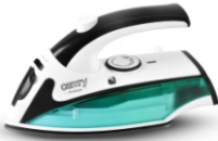
Travel Iron CR 5024