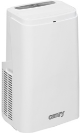
Air conditioner CR 7907