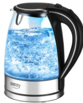
Electric Kettle CR 1239