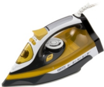
Steam Iron CR 5029