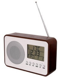
Radio CR 1153