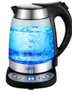
Electric Kettle CR 1242