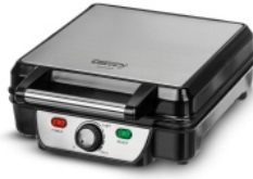
Waffle maker CR 3025