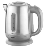
Electric Kettle CR 1278