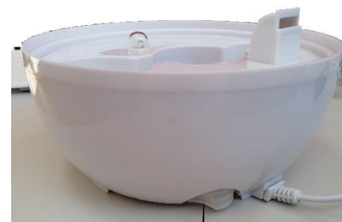
Zbiornik na olejki zapachowe