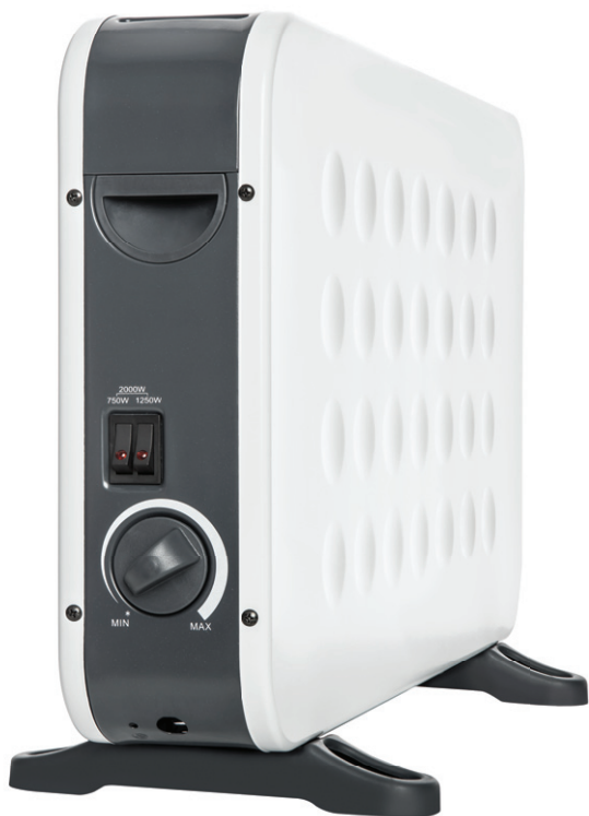
GRZEJNIK KONWERTOROWY MCH100E